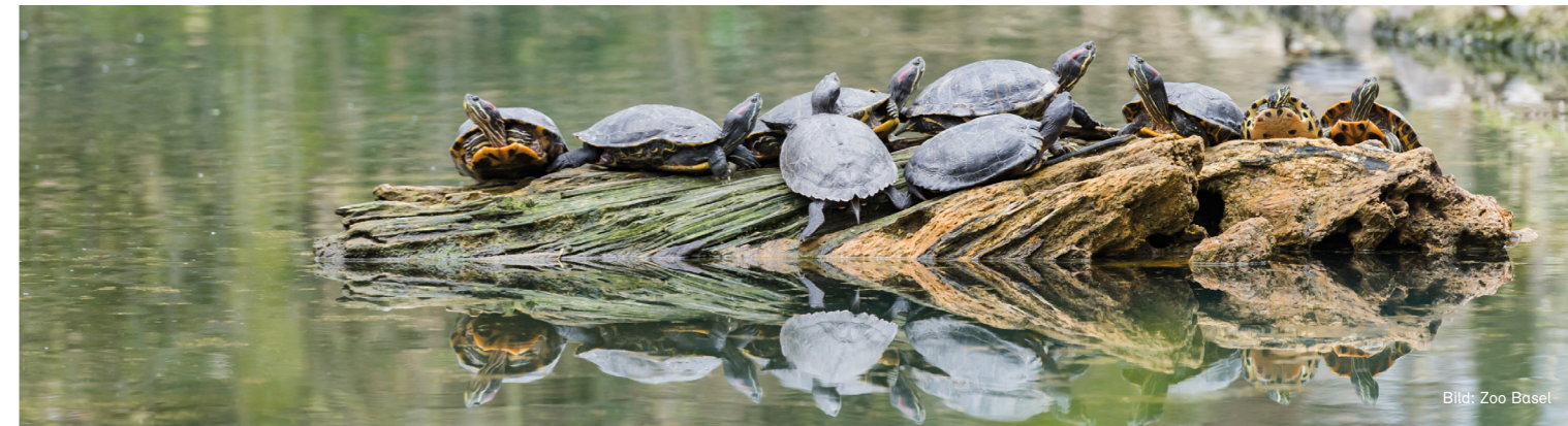
Rotwangen-Schmuckschildkröten beim Sonnenbaden

Seit einigen Jahren werden vermehrt Rotwangen-Schmuckschildkröten in der freien Natur gesichtet. Wer ein solches exotisches Tier findet, sollte es der zuständigen kantonalen Behörde melden. Die Kantone unterhalten Fachstellen – sogenannte Neobiota-Stellen – für invasive gebietsfremde Organismen, zu denen auch die Rotwangen-Schmuckschildkröte gehört. Auf jeden Fall ist dafür zu sorgen, dass das Reptil in eine registrierte Einrichtung kommt oder eingeschläfert wird.