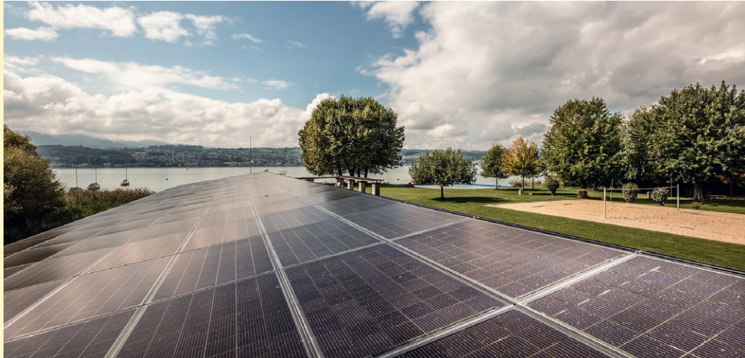
Männedorf ist auf dem Weg zum Label Energiestadt Gold: Solaranlage beim Strandbad.

Erich Meier, Ressortvorsteher Infrastruktur