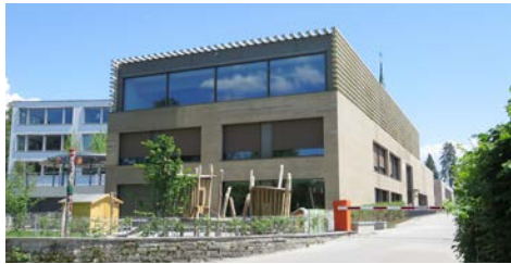
Mehrzweckgebäude Blatten mit Bibliothek im 2. Stock.