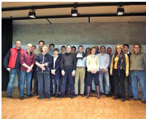
TeilnehmerInnen des Leitbildworkshops

In das vorliegende Jugendförderungskonzept sind sowohl die Erkenntnisse aus den erwähnten Schritten als auch die allgemeinen Erfahrungen und Erkenntnisse aus der Jugendarbeit in der Schweiz eingeflossen.